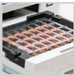
Einzel- und Mehrfachdosis