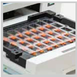
Einzel- und Mehrfachdosis